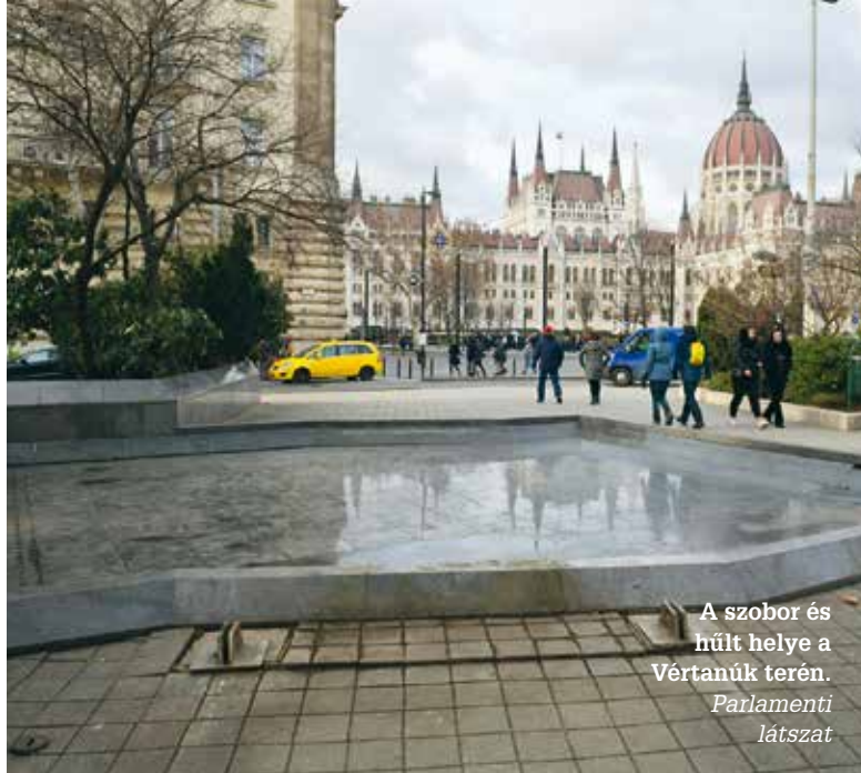
A szobor és hült helye a Vértanúk terén. Parlamenti látogatás